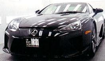
〔被膜硬化乾燥ブース〕

クォーツガラスコーティングFXは空気中の水分と反応し、ボディに無機ガラス膜を形成、ボディを汚れから守ります。湿度・温度が施工に大きく影響するため、一定を保つ専用ブースでの施工環境にごこだわっています。