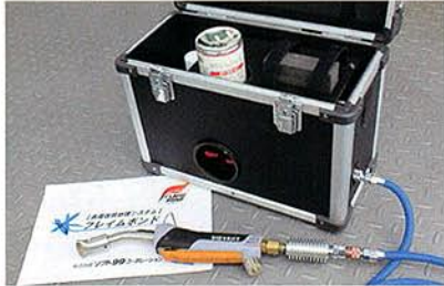
新しく導入するソフト99製表面改質処理システム「フレイムボンド」は、表面を炙ることで酸化ケイ素皮膜を形成し、高い密着力を発揮する。