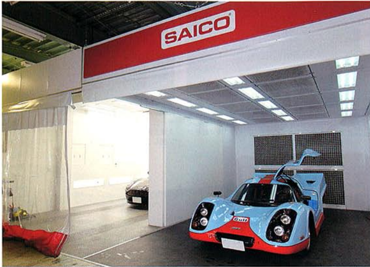
某著名評論家とも邂逅済みのポルシェ 917レプリカが収まる、自慢のサイコ社製ブース。クオリティの高い美装を追求するために導入した。

営業時間/9:00~19:00 定休日/年中無休 〒577-0016 大阪府東大阪市長田西5-4-11 ☎0120-678-817 ☎06-6746-8988 http://www.carbeauty.co.jp/