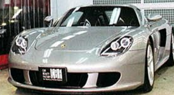
〔被膜安定定着ブース〕