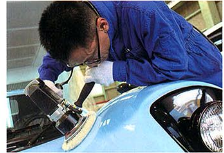
新型ポリッシャーの試験導入にも意欲的な同店は、磨きのレベルも一級品。同店から全国へ伝播していった技術も多数ある。