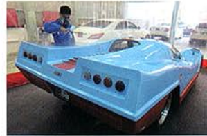
集塵効果の高いシロッコファンとサイコ社製ブースの組み合わせが、高品位なガラス膜を生む。寺園代表の妥協なき姿勢が垣間見える象徴的な光景だ。