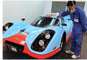
全国のクォーツ取扱店のなかでも、優れた施工技術が認定された精鋭店のみが加盟できる「JQC(ジャパンクォーツクラブ)」に所属する。