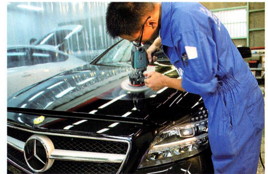
ケイテック製ポリッシャーを用いた磨き作業風景。作業効率やクオリティの向上に繋がると、現場スタッフからもなかなか好評の様子。

最近依頼が多いという内装クリーニング。手間暇を惜しまない徹底した作業により、とことん汚れを除去する。スーパークーラーなども対応している。