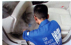
スチームを用いたフロアカーペットの清掃作業風景。コーヒの染みなどもキレイになるので、作業シーズン後には依頼が殺到するとか。