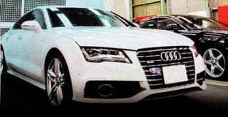
〔被膜安定定着ブース〕