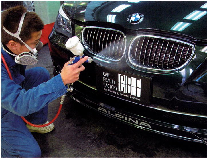
正規ディーラーやユーザーを問わず、施工件数が多いBMW。同店はジャパンクォーツクラブ加盟店でもあり、コート技術はすこぶる高い。