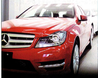
〔被膜硬化乾燥ブース〕