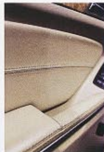
最近依頼が多い室内クリーニング。オゾン水を用いた清掃作業、オゾンガスによる除菌等、同店自慢のシステムが人気を集めている。