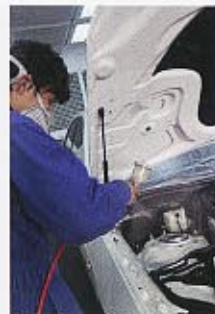
手の届かない部分にも施工可能なクォーツガラス。同店では、エンジンルームやフェューエルリッド内側、ホイール等にも施工している。