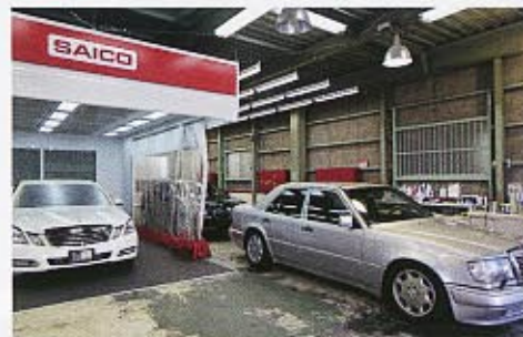
作業工程別に各種ツールが効率良くレイアウトされたファクトリー内。メルセデスやBMWなどの高級車が数多く入庫する。