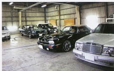
車両を動かさずことなくじっくりと一台一台に達した作業が行える軽年車専用の第2ファクトリー。アンチエイジング拠点として機能中。

また、感覚で語られがちだったデ イテリングを可視化するために、 ユーザー立ち会いの下、膜厚計と光 沢計を用いて塗膜やコート施工前後 を数値化して実証する。最近、軽 年車専用の、アンチエイジング。拠 点も新たに設けただけでなく、ク ォーツガラスはじめ、各種コート施 工後の旧車に対する適切な管理方法 についてを模索中。オールドメルセ デス愛好家が多いだけに、どんな答 えが導き出されるのか興味深い。