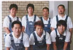
カービューティ・ファクトリーの精鋭陣。みな若く、気持ち良い対応が印象的。写真後列向かって右が同店を主宰する寺園代表。

→阪神高速東大阪線長田出入口が最寄り。そこから10分も走れば同店がある。最近、移転オープンを果たしたばかりで設備も充実。